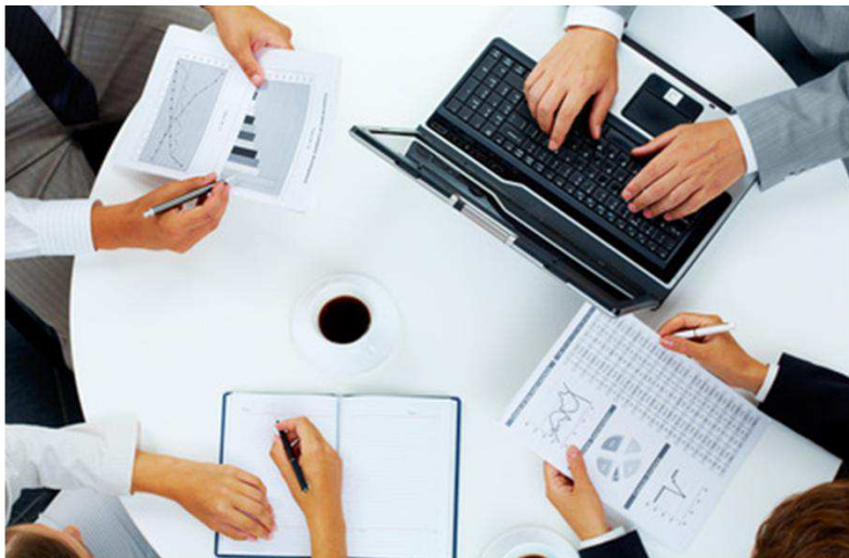
Experiencia de 2 días de aprendizaje en equipo